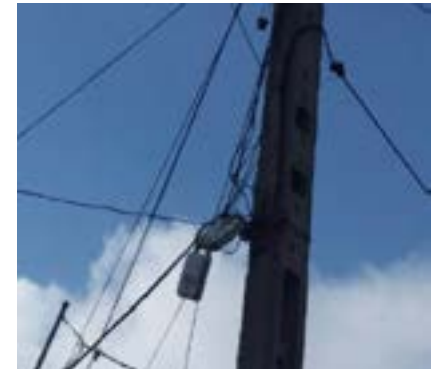
muy mala forma al parecer tenía un mal día, se hizo el reporte a ETECSA mandaron un camión pusieron unos cables y se fueron dice que mañana mandarían a los técnicos para que instalen las cajas y los pares de las líneas a las casas que somos muchos los perjudicados.

En el día de hoy vinieron a podar unas matas y arrancaron todo los cables de la telefonía, yo salí y les pregunte quien era el jefe y me respondieron que no estaba y que ellos no tenían nada que ver con eso, los perjudicados teníamos que llamar a ETECSA para que lo vinieran arreglar, se llamó a comunales