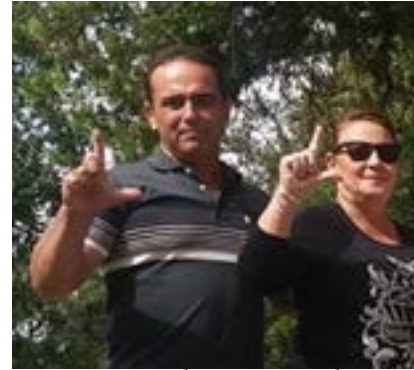
¿Quiénes controlan las boletas personas confiables del partido comunista?