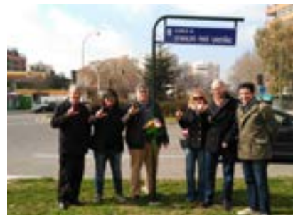
El MCL, hermanos y amigos rindieron hoy homenaje a El Oswaldo Payá en la glorieta de Madrid que lleva su nombre, colocando un ramo de flores en uno de los carteles que la señalizan.

Oswaldo Payá fundador y líder del Movimiento Cristiano Liberación nació en La Habana el 29 de febrero de 1952