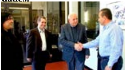
En un video difundido por el Alcalde de Miami Tomas Regalado expresó su apoyo a la iniciativa del MCL de reforma de la ley electoral “Un cubano , un voto” y ha hecho un llamado a alcaldes de otras ciudades del estado de Florida a solidarizarse con dicha iniciativa. El alcalde recibió el pasado noviembre a Regis Iglesias, Eduardo Cardet y Minervo Chil, de MCL