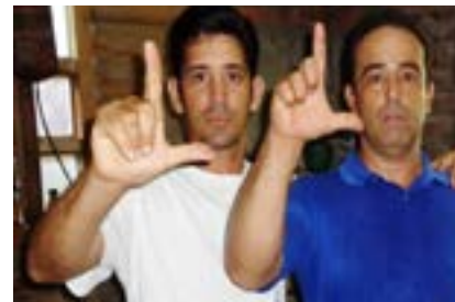
“El juicio está previsto para el lunes 20 de febrero pero no hay nada seguro pues el tribunal de Velasco solo trabaja los martes y jueves”

“Las calles se van llenar de personas que van a defender a Eduardo (amigos, sociedad ci-