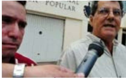
Oswaldo Payá Sardiñas cumpliría hoy 65 años de edad. Pero la dictadura cubana lo asesinó. Se había convertido en la auténtica piedra en su zapato.

En 1988 fundó el Movimiento Cristiano Liberación (MCL), organización inspirada en el mensaje liberador de los Evangelios y en los principios del Humanismo Cristiano, desde el que desarrolló toda su actividad política y que dirigió hasta su asesinato. Oswaldo articuló un movimiento cívico que logró, pese a la represión y los intentos de infiltración y tergiversación, recolectar la firma de más de 35000 ciudadanos cubanos con derecho al voto apoyando el Proyecto Varela, que solicita a la Asamblea Nacional la celebración de un referendo para que el pueblo cubano decida en las urnas si quiere o no que las