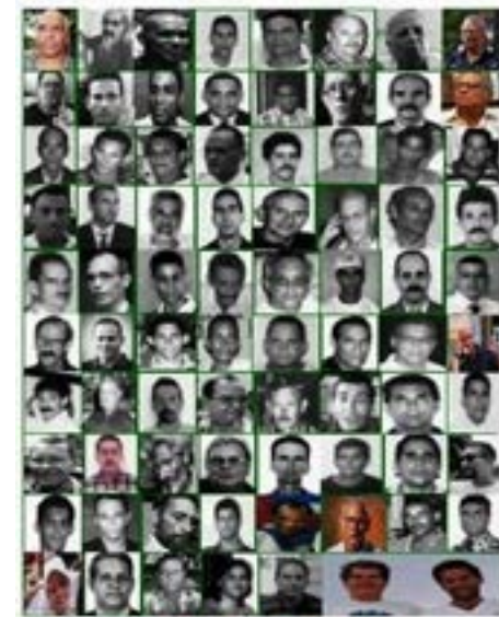
2003-2017 XIV ANIVERSARIO LA PRIMAVERA RENACERÁ

Lo que sí es Sagrada es la causa, la causa por la libertad de Cuba.