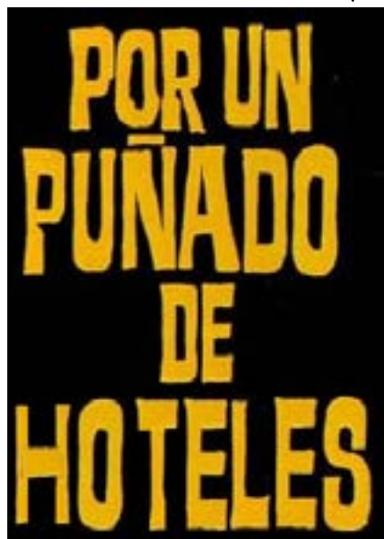
Ilustración: Carlos Payá

Recuerda que los cubanos no pueden cobrar un salario, que no tienen derecho a huelga y que una compañía no puede contratar libremente a un empleado.