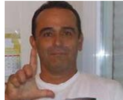
Hoy 1 de Junio fui víctima de un arresto en plena calle, alrededor de las 9:30 pm, me trasladaron en el jeep de la policía de Velasco (#735) hasta un lugar apartado