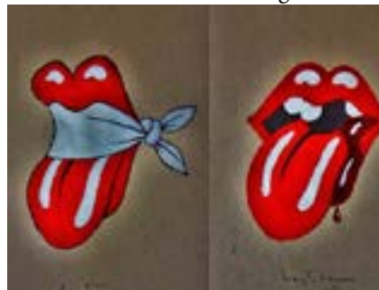
Ilustración: Sergio Lastres

Este Viernes Santo, la Habana escuchara las guitarras y las voces de los que en mi niñez casi nadie podía escuchar. No tengo dudas que detrás de la fecha, esta la intención y lo peor de todo es que ninguna de las Iglesias que este Viernes reunirán a sus fieles para recordar el martirio de Jesús puedan alertar como mi madre de que “el diablo esta suelto”.