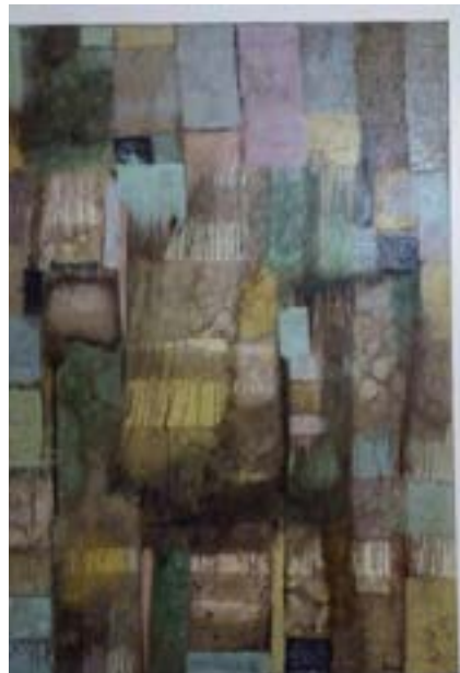
Ilustración: Nedine Valle