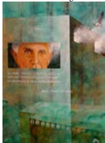
Ilustración: Sergio Lastres

Esta mañana varias organizaciones cubanas de derechos humanos han hecho públicos varios listados de prisioneros políticos en respuesta al desmemoriado dictador. Un listado parcial enviado por el Directorio Democrático Cubano, basado en informes de tres grupos de la disidencia que trabaja en condiciones de persecución y acoso