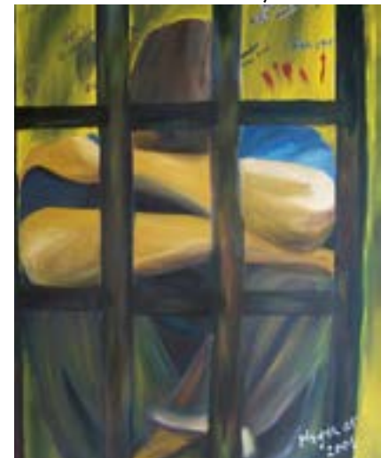
Ilustración: Mayda Sabourit