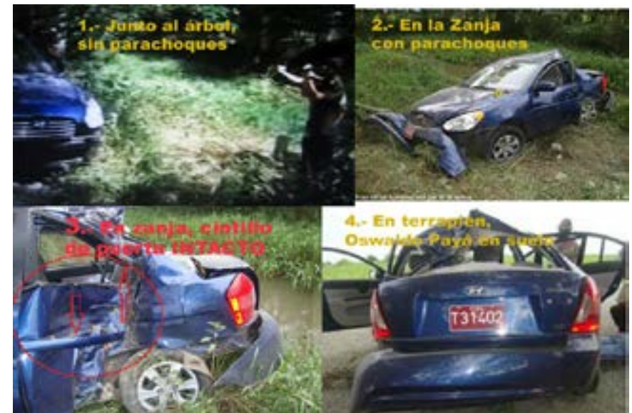
Ilustración : Carlos Payá

El informe presentado a la Relatora Especial de la ONU concluye: “La evidencia que el Estado cubano ignoró deliberadamente sugiere que los acontecimientos del 22/07/12 no fueron un accidente, algo afirmado rápidamente por las autoridades en un medio de comunicación de propiedad estatal, y más tarde dado por concluido en la Corte del sistema totalitario de Cuba. Más bien, la muerte de Payá es el resultado de un accidente automovilístico causado directamente por agentes del Estado, con la intención de matar a Oswaldo Payá y sus compañeros de viaje e, o de infligir lesiones corporales graves a los mismos”.