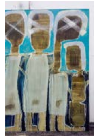
Ilustración: Nedine Valle

El otro punto es el mecanismo de legitimación de los acuerdos de paz en La Habana con las FARC que puede ser vía plebiscito (con el 13% del censo electoral, lo que equivaldría al menos a 4,4 millones de votos) como un mecanismo de participación ciudadana; una declaración unilateral del presidente o una resolución del Consejo de Seguridad de la ONU. Cualquiera que se llegue a dar funcionará si no se pasa de largo al constituyente primario, ya que el verdadero legitimador del proceso no será la guerrilla, la comunidad internacional o el Gobierno Nacional sino la sociedad civil, la población colombiana, o sea, cada uno de nosotros como únicos receptores directos de las consecuencias de las negociaciones.