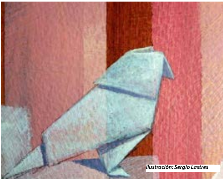
Ilustración: Sergio Lastres

Es nuestro propósito y anhelo la reconciliación, nuestra disposición sincera es al diálogo con todos, un diálogo de y entre todo el pueblo cubano para que los ciudadanos rescaten la soberanía popular expresada libremente con su voto. No estamos dispuestos a entregar al César nuestra conciencia y nuestra libertad como hijos de Dios, como Pueblo de Dios y que nos fue dada por Dios.