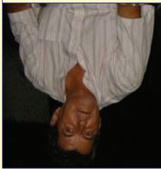
Oswaldo Payá Sardinas

Read the Full Text at www.nationaldialoguecuba.org .